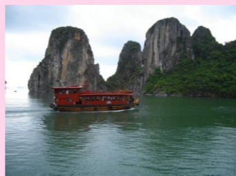
世界遺産 ベトナム：ハロン湾 登録区分：自然遺産 登録年：1994年