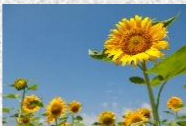
日本風景写真家協会作品紹介