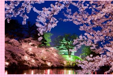
日本風景写真家協会作品紹介