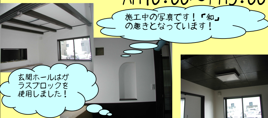
施工中の写真です！『和』の趣きとなっています！

4月14日(土),15日(日) 場所：長岡市平島町 AM10:00~PM5:00