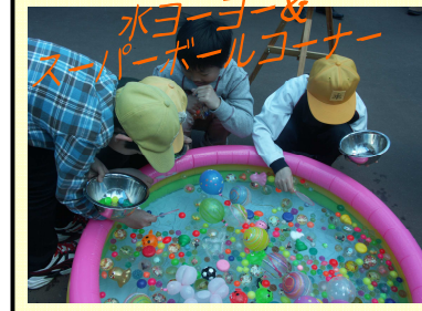
水ヨーヨー& スーパーボールコーナー 皆様のご来場 お待ちしております！ 射的コーナー

昨年の感謝祭の様です！恒例のコーナーから、新たなお楽しみコーナーまで盛りだくさんでお待ちしております！