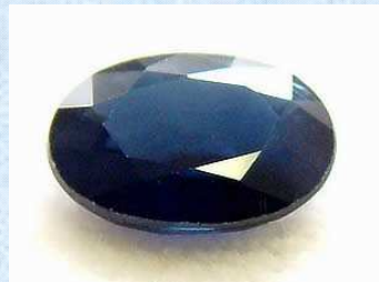
9月の誕生石：サファイア 象徴(意味)：純愛・誠実・純潔