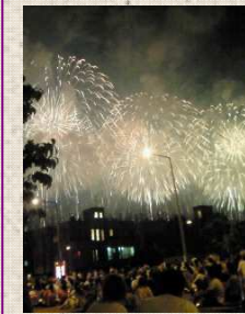
花火師さん、ありがと〜。(おととしの写真 ですが・・・)

タイトル：言うまでもなく 2010年8月4日 水曜日 清水です。 ついに昨日で一大イベントの長岡花火が終わってしまいま した。 日本に・・・いや、世界に誇ると言ってしまうても過言ではな いであろう長岡の花火。 やはり今年も素晴らしいかったです。 もはや言うまでもありませんね。 長岡人として鼻が高いことこの上なし。です。(私の地元は見 附ですが・・・) ↓素晴らしいフェニックスの写真を掲載して今日は終わりにし たいと思います。